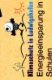
Klimaschutz in Ludwigshafen Energieeinsparung in Schulen