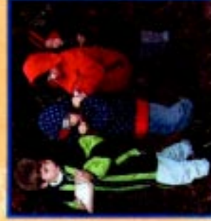
Außerschulischer Lernort Müllheizkraftwerk Ludwigshafen