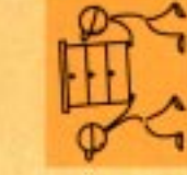
Möbelabfuhrung der GEBEGE