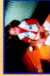
Kindergartenwettbewerb „Saubere Stadt“