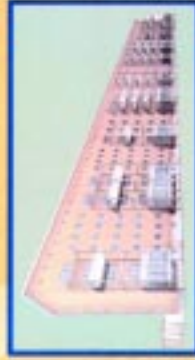
GAG-Wohnungen, Soziale Stadt im Westend