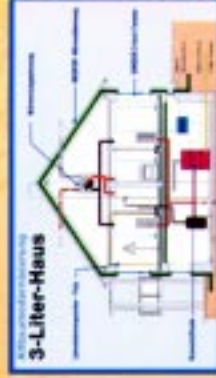
Drei-Liter-Haus der LUWOG im Brunckviertel, Friesenheim